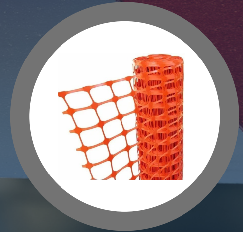
MALLA CERCADORA 45 METROS