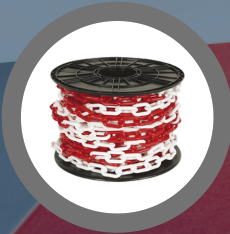
CADENA CONECTORA 45 METROS