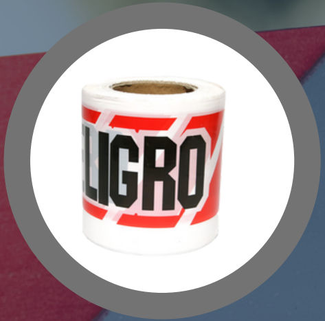
CINTA DE PELIGRO 350 METROS