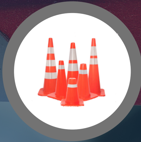
CONO 18", 28" Y 36"