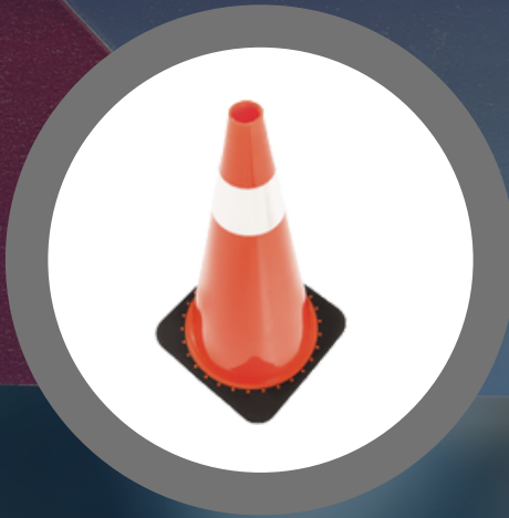
CONO 36" BASE NEGRA NORMAL Y ANTIVIENTO